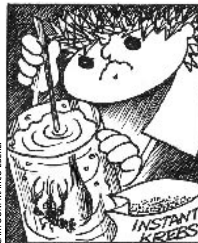
CARTOON: MARCO EBERLI

Unsere Fragen über Art und Bedürfnisse dieser Krebse hingegen blieben ungehört. Da die «Urzeit-