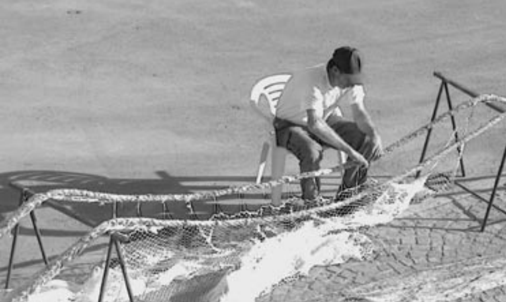
Italienischer Fischer beim Netzflicken – trügerische Idylle, für die Fischer wie für die mit Grundschieppnetzen gefangene Beute.