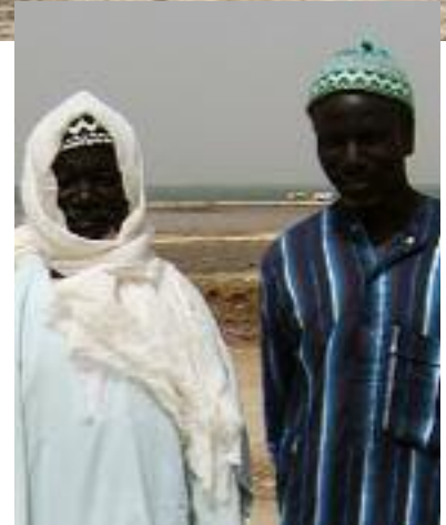
D'accord! Der Dorfchef und der Chef der Fischer von Rofangué bekräftigen es: Alle Fischer hier wollen bei fair-fish mitmachen.