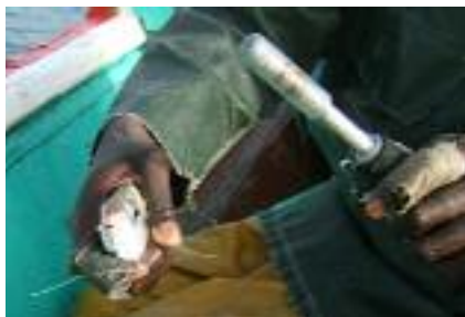
Kopfschlag (oben) und Kiemenschnitt (rechts) mit dem fair-fish-Stock.

In den verschiedenen Tötungsarten konzentriert sich auf einem Boot am ehesten der Kiemenschnitt zur Ausblutung des Fisches: mit einem durch die Kieme eingeführten Messer wird die Herz-Kiemerarterie durchtrennt.