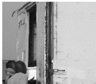
Die kontrollierten Fische werden in Eis und Kisten per Kühlauto in die Fabrik gefahren. →