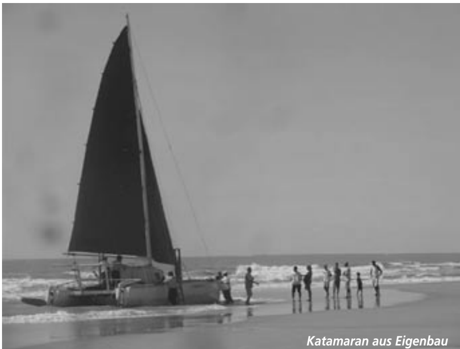
Katamaran aus Eigenbau

fairunterwegs.org >> Suchbegriff «prainha»