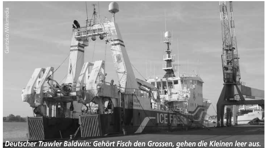
Deutscher Trawler Baldwin: Gehört Fisch den Grossen, gehen die Kleinen leer aus.

Ich gebe zu, das hat mich verblüfft. Obwohl jedermann in der Fischereindustrie all die populären Schlagwörter wie Nachhaltigkeit, Nachverfolgbarkeit und Erhaltung der Fischbestände kennt, zeigt die Tatsache, dass eine Konsumentin ihren Kaufentscheid tatsächlich davon abhängig macht, ob der Fisch nachhaltig gefischt wurde, wie weit die Industrie in den letzten zehn Jahren gekommen ist. Obschon die Fischereindustrie diese Themen anfänglich als Einmischung betrachtete, anerkennen mittlerweile alle Beteiligten, vom Fang bis zum Verkauf, dass es nicht mehr genügt, Fisch als Qualitätsprodukt anzupreisen – egal, wie ansprechend der Fisch präsentiert wird. Heute muss man den