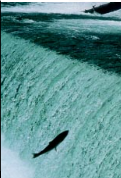
Springender Lachs auf der Wanderung. Foto Titel: Königslachs. Innenseite: Intensive Lachsfarm; Silberlachs.