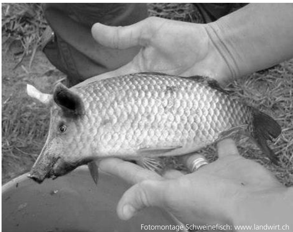
Fotomontage Schweinefisch