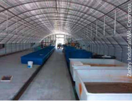
Einrichten einer Kreislaufanlage in einem Gewächshaus

abgesehen. Entwichene Zuchtfische können Krankheiten auf die Wildbestände übertragen, sie können für die Wildbestände zudem zur Konkurrenz bei Ernährung und Fortpflanzung werden, bis hin zur Verdrängung einer wildlebenden Art. 2