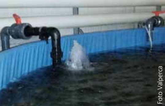
Rundbecken: Valperca experimentiert mit variierenden Wassereinflusswinkeln

Die 2009 in Betrieb genommene Anlage der Firma Valperca AG besteht aus einem zu zwei Dritteln geschlossenen Wasserkreislauf für ein paar Dutzend Rundbecken in einer grossen Halle. Bis zu 450 Tonnen Fische können hier pro Jahr produziert werden (entspricht 180 Tonnen Filets).