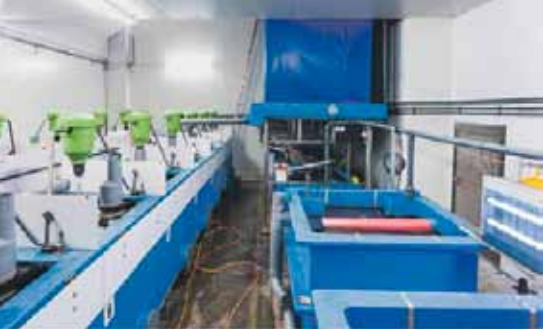
Eine Kreislaufanlage, wie sie die niederösterreichische Landwirtschaftskammer ihren Bauern empfiehlt. (Aus: «Die Landwirtschaft» 11/2013)

RAS-Modulen Kirschenlachse oder Zander 10, 11 mästen. Die neueste Werbebotschaft dieser Art verspricht Crevetten von einem Bauernhof im Thurgau.