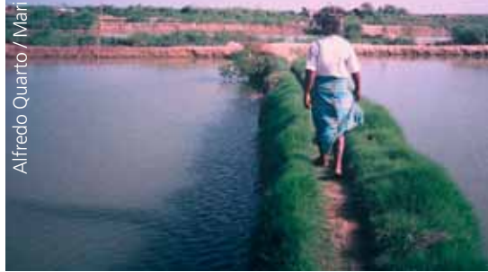
Nach Seuche verlassene Shrimpszucht in Sri Lanka