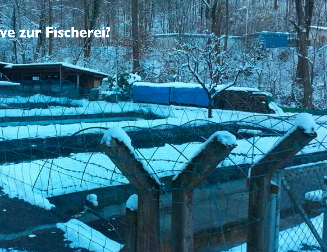
Fischzucht in Trimbach bei Olten: Bachforellen für den Besatz der Aare.

RETO WYSS • Vor etwa 4500 Jahren begann der Mensch, Karpfen zu züchten. Die Mast von Fischen, Muscheln, Krustentieren und Wasserpflanzen nimmt aber erst seit den 1970er Jahren explosiv zu. Bei einer jährlichen Zuwachsrate von sieben bis neun Prozent ist es nicht erstaunlich, dass dringender Forschungsbedarf besteht.