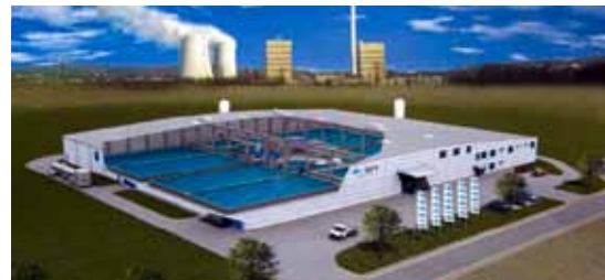
Modellansicht der MFV in Völklingen

In der saarländischen Montanindustriestadt Völklingen wurde Anfang 2013 die erste landgestützte Meeresfischzucht Europas in Betrieb genommen. Die komplett geschlossene Kreislaufanlage ist auf eine Produktion von 650 Tonnen Fisch im Jahr ausgelegt; eine Erweiterung am Standort wäre möglich. Im künstlich vor Ort hergestellten Meerwasser schwimmen Doraden, Wolfsbarsche, Gelbschwanzmakrelen und Störe. Seit April 2014 verkauft die Meeresfischzucht Völklingen (MFV) Fische an die Ketten Globus und Edeka Südwest.