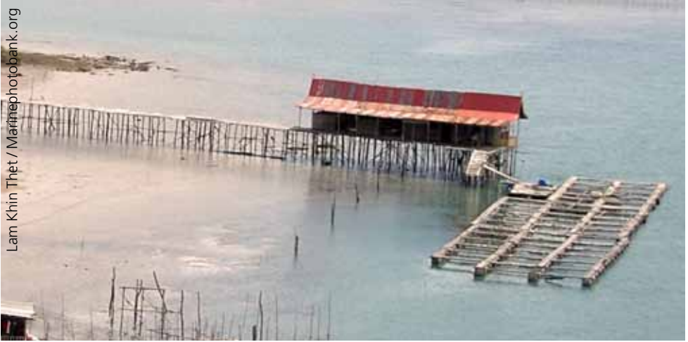
Traditionelle Plattform von artisanalen Fischern in Indonesien für Fang und Zucht.