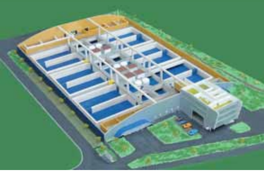
Modellansicht Anlage OceanSwiss

de Buttisholz fündig und erhielt Anfang Februar 2012 die Baubewilligung für eine RAS-Anlage mit einer Jahresproduktion von über 1000 Tonnen Fischen oder bis zu fünf Tonnen pro Tag.