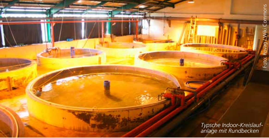
Typische Indoor-Kreislaufanlage mit Rundbecken